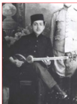
Der Tar-Spieler Morteza Neydāvud (1900 bis 1990)

■ Charakteristisch für die aserbaidchanische Tar ist ihr doppelt ausgebauchter Resonanzkörper . Im Unterschied zur persischen Variante ist sie meist etwas weniger stark tailliert; in Aserbaidschan werden oft bei größeren Instrumenten die beiden Korpusteile separat gefertigt und anschließend zusammengefügt. Der Korpus besteht in der Regel aus Holz, häufig vom Maulbeerbaum, während der Steg auf